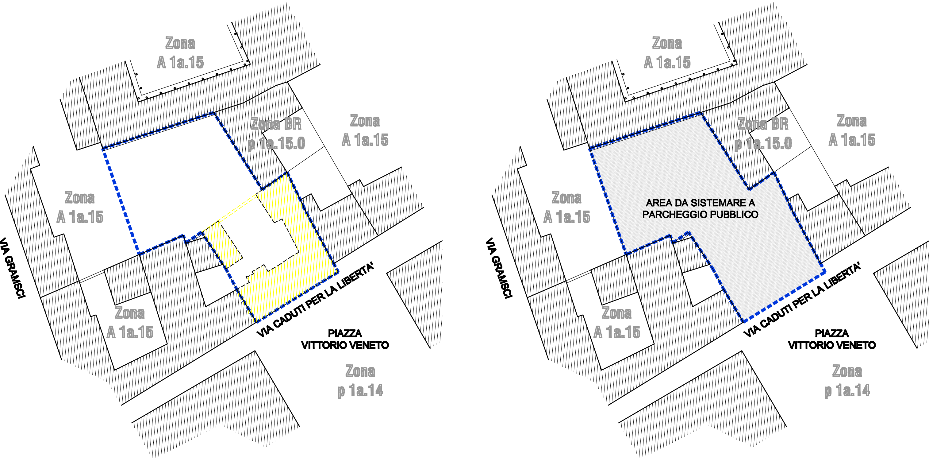
PLANIMETRIA DI PREVISIONE LOTTO B Scala 1:500

N.B.: L'INTERVENTO PREVISIONALE DEL LOTTO B, SE PUR INSERITO NEL PRESENTE P.P. SARA' ESEGUITO IN UNA SECONDA FASE E SARA' OGGETTO DI SUCCESSIVA PROGETTAZIONE ED ESECUZIONE A TOTALE CARICO DELL'AMMINISTRAZIONE COMUNALE.